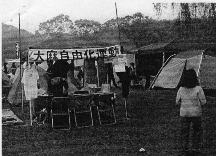
大麻自由化運動の店