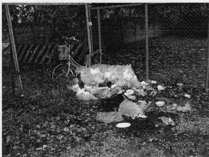
道に放置されたゴミ